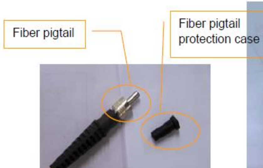
شکل ۱-۲. تصویر پیگتیل و درپوش فیبر لیزر