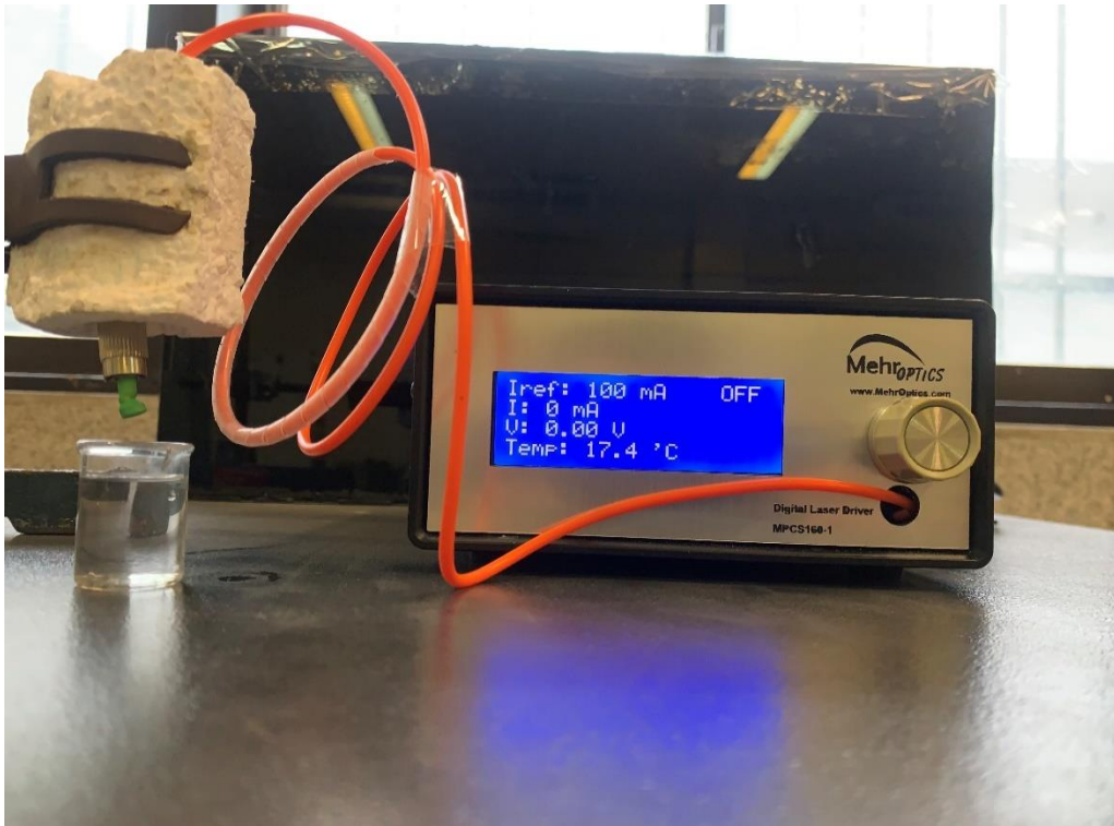
شکل ۳-۱. نمای جلوی دستگاه لیزر ۹۸۰ نانومتری