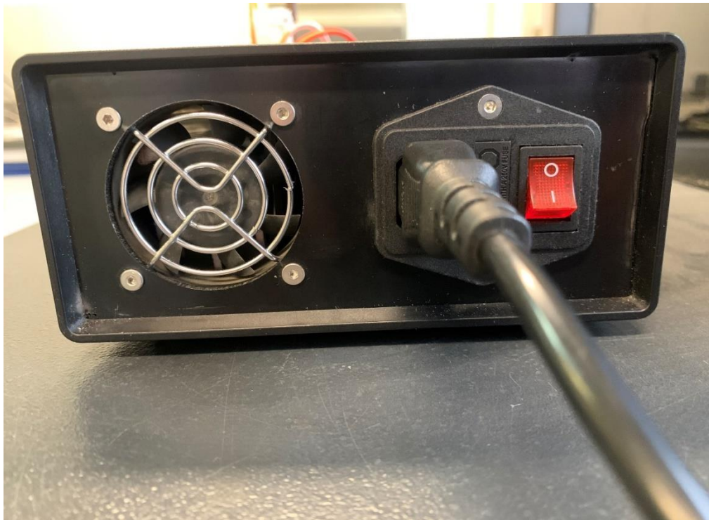
شکل ۳-۲. نمای پشتی دستگاه لیزر ۹۸۰ نانومتری